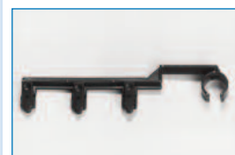
Filmbügel X-3 für alle Kleinformat

Sehr leistungsstarkes Heizungsgebläse für rasche und effiziente Trocknung der Filme