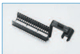
Status-Entwicklerkorb X-3 für bis zu 18 Filme (2 x 3 cm und 3 x 4 cm)